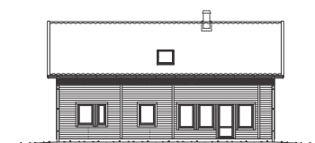
FASAD MOT BAKSIDA