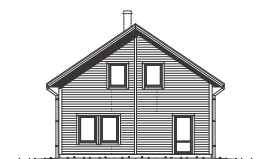
FASAD MOT VÄNSTER