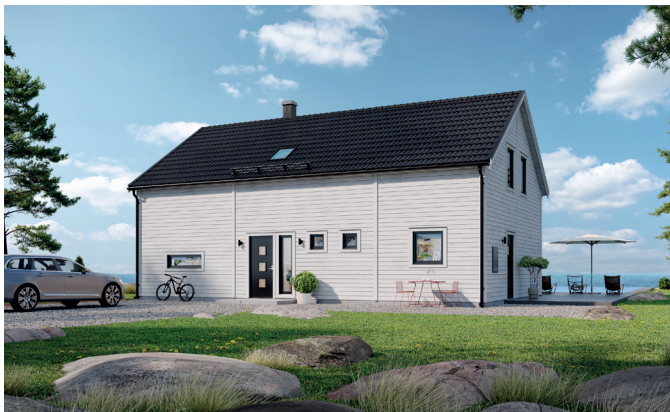
Huset har förhöjt väggliv och kan därmed komma att klassas som ett 2-planshus vid bygglovsprövning. Illustrationerna visar även tillval.

I detta rymliga hus finns plats för både vardag och fest. Entrén har gott om förvaringsutrymme och en praktisk förskjutning av trappan till övervåningen så att grus och smuts stannar vid dörren. Känslan är luftig, inte minst tack vare rundgången mellan kök, vardagsrum och entré. På nedre plan finns möjlighet till ett extra sovrum eller en rymlig klädkammare och separata utrymmen för wc/dusch och klädvård. En trappa upp finns fyra generösa sovrum och ett mindre som du kan välja att ansluta som klädkammare till det största sovrummet. På detta plan har du möjlighet att få både dusch och badkar i badrummet. Tillvalsmöjligheterna är många – till exempel fönsterdörr till stora sovrummet, rejäl köksö med sittplatser, 3-fackskupa i mitten av huset och balkong i anslutning. Amerikansk veranda från groventrésida till entrésida, skärmtak (pulpet eller sadel) vid entré och stora fönsterpartier i vardagsrum/vid matplats är ytterligare några.