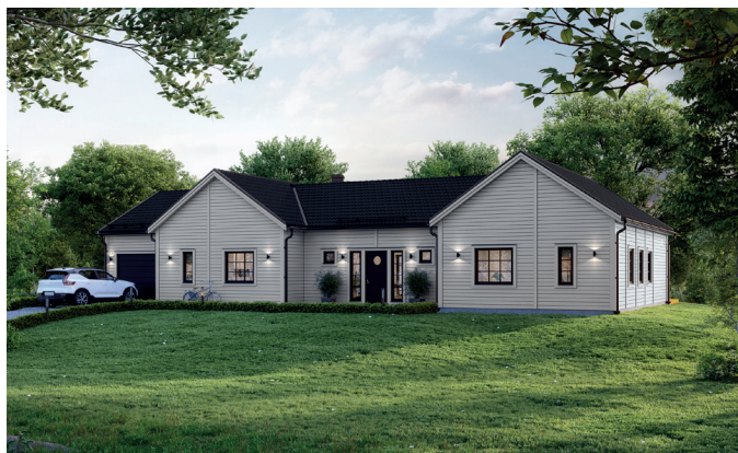
Illustrationerna visar även tillval

Det här stora enplanshuset i spännande H-form delar hemmet i två delar – som låter sig förenas i en välbalanserad helhet med matplats och kök som mittpunkt. Entrén med kapprumsdel är på en gång funktionell och inbjudande. I husets ena del kan barnen få en hel flygel för sig själva med fyra sovrum, badrum och gemensamt allrum. På andra sidan finns det luftiga vardagsrummet och föräldrasovrummet med närhet till både badrum och gedigen klädvard. Välj till kopplat garage för en smart ingång till klädvården! Gillar du storslaget kan du också välja till ryggåstak i vardagsrummet fönster i gavelpetsarna.