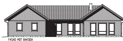
FASAD MOT BAKSIDA