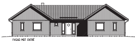
FASAD MOT ENTRÉ

Det här stora enplanshuset i spännande H-form delar hemmet i två delar – som låter sig förenas i en välbalanserad helhet med matplats och kök som mittpunkt. Entrén med kapprumsdel är på en gång funktionell och inbjudande. I husets ena del kan barnen få en hel flygel för sig själva med fyra sovrum, badrum och gemensamt allrum. På andra sidan finns det luftiga vardagsrummet och föräldrasovrummet med närhet till både badrum och gedigen klädvard. Välj till kopplat garage för en smart ingång till klädvården! Gillar du storslaget kan du också välja till ryggåstak i vardagsrummet fönster i gavelpetsarna.