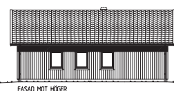
FASAD MOT HÖGER