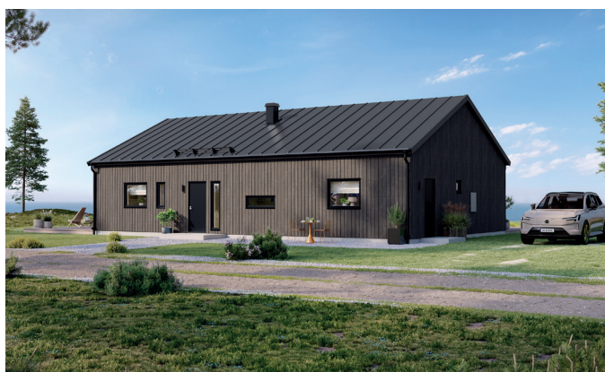
Illustrationerna visar även tillval

Det här är ett hus med smart planlösning och välutnyttjade ytor. Fönstrens placering ger ett modernt intryck och ett fint flöde av det viktiga ljuset. Här finns många möblerbara väggar och mycket goda förvaringsmöjligheter. En egen avdelning för barn och gäster, de generösa sällskapsytorna och WC/dusch i anslutning till master bedroom, är exempel på ytterligare plus. I tillvalsutbudet hittar du ryggåstak i vardagsrum, tak över uteplats, ett extra sovrum i allrumsdelen, bastu och mycket mer.