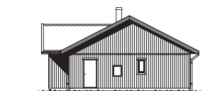
FASAD MOT HÖGER