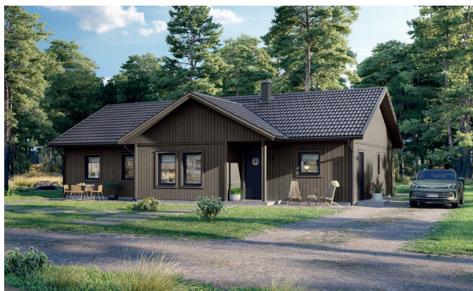
Illustrationerna visar även tillval

Det här är ett oerhört välplanerat hus med fem till sex rum, generösa sällskapsutrymmen och rejäl klädvard och förvaring på ett enda plan. Den öppna planlösningen i husets mitt skapar naturliga centralpunkter där hela familjen kan samlas – samtidigt som det finns gott om möjlighet till egentid med sovrum och allrum i ena änden av huset, och master bedroom, med praktisk anslutning till walk in closet, i den andra. Tillvalen burspråk och braskamin höjer mysfaktorn hela året med extra ljusinsläpp om sommaren och något att kura ihop sig framför när det mörknar.