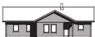
FASAD MOT ENTRÉ

Det här är ett oerhört välplanerat hus med fem till sex rum, generösa sällskapsutrymmen och rejäl klädvard och förvaring på ett enda plan. Den öppna planlösningen i husets mitt skapar naturliga centralpunkter där hela familjen kan samlas – samtidigt som det finns gott om möjlighet till egentid med sovrum och allrum i ena änden av huset, och master bedroom, med praktisk anslutning till walk in closet, i den andra. Tillvalen burspråk och braskamin höjer mysfaktorn hela året med extra ljusinsläpp om sommaren och något att kura ihop sig framför när det mörknar.