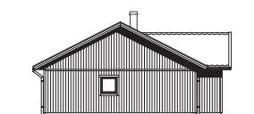
FASAD MOT VÄNSTER