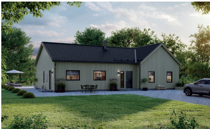
Illustrationerna visar även tillval

Här erbjuds ett välplanerat vinkelhus med hemtrevlig känsla. Ett hus som passar de flesta familjekonstellationer – ett avskilt föräldrasovrum med egen klädkammare och i andra änden av huset en sovrumsdel med fyra sovrum och eget allrum. Köket och vardagsrummet är husets hjärta som bjuder in till sociala kvällar med matlagning och umgänge. Huset har ett fint samspel mellan avskildhet och öppenhet.