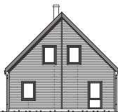
FASAD MOT VÄNSTER