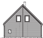
FASAD MOT HÖGER