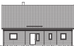
FASAD MOT ENTRE

Start 168 är ett ljus och luftigt hus med stora möjligheter. I standardutförande erbjuds huset med oinredd övervåning för dig som vill inreda den vid ett senare tillfälle. Som tillval erbjuds inredd övervåning vilket möjliggör ett hus med upp till sex sovrum utan att göra avkall på de sociala ytorna. Ett perfekt hus för den växande familjen.