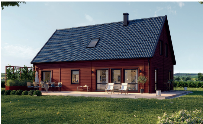
Illustrationerna visar även tillval