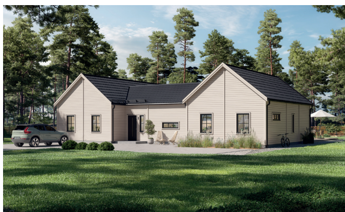
Illustrationerna visar även tillval