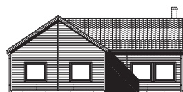
FASAD MOT BAKSIDA