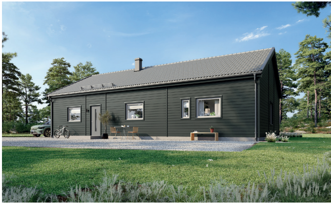
Illustrationerna visar även tillval