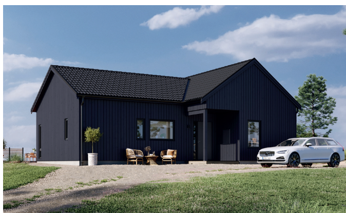
Illustrationerna visar även tillval

Välkommen till en riktigt trevlig enplansvilla. I sin avlånga smärta form passar den de flesta tomter. Den takbeprydda entrén ger en omedelbar ombonad känsla, och väl inne öppnar hallen direkt upp till härliga siktlinjer och ljusinsläpp. Nischad köksdel och stor köksö ger gott om förvaring i köket, som tillsammans med matplats och vardagsrum bildar en rymlig enhet med dubbeldörr ut till vind- och insynsskyddad altan i vinkel. Direkt tillgång till utsidan har du också från det största sovrummet, beläget i behagligt avskild flygel med eget badrum, skjutdörrsgarderob och klädkammare – med anslutning till tvättstuga. Välj till ryggåstak i kök och vardagsrum för extra höjd upp i nock.